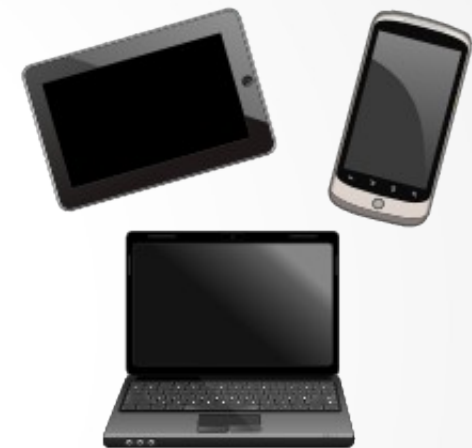
Linux / Windows / Mac / Android